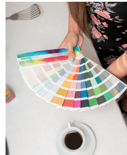
У ОДНОГО ЦВЕТА МИЛЛИОНЫ ОТТЕНКОВ

Н е поддавайтесь моде, она девушка ветреная. Никто не запретит вам быть в тренде, но если тенденции конструктивны, расположения, материалов и их сочетаний держится по несколько лет, то цвет как правило на пике популярности лишь сезон\два. Если судьба преподнесла Вам подарок и новомодный цвет всю жизнь был вашим любимым, то постарайтесь сохранить самообладание и оставить этот цвет фишкой интерьера, а в остальном поддержите его сочетанием классических цветов и оттенков. Не стоит делать комнату во всех цветах радуги, используйте 1,2 основных цвета, добавьте акцент (тот самый любимый цвет). Не забывайте, что у одного цвета миллионы оттенков. Играя тоном одного цвета вы рискуете получить невероятно гармоничное пространство. Ведь множество текстур с разницей в несколько тонов одного цвета будут интересной композицией воспринимаемой целостно.