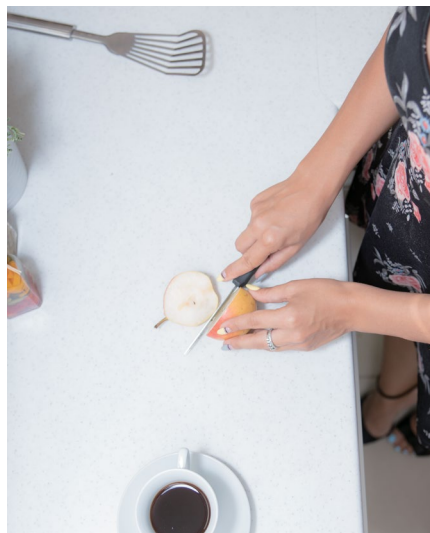
АБСОЛЮТНО ЛЮБОЙ МАТЕРИАЛ МОЖНО ИСПОРТИТЬ

А нтивандальность, термин-братэкологичности. Сколькочеловек столько взглядов, как говорится. Давайте раз и навсегда запоем, что АБСОЛЮТНО любой материал можно испортить, если иметь такую цель. Понятно, что когда вы выбираете мебель и являетесь счастливым родителем юных экспериментаторов, для которых в играх все средства хороши, вы переживаете как долго мебель сможет терпеть натиск детей. Но стоит взглянуть правде в глаза, никто не делает стены в детских из гранита, гармонично вписывая на пол асфальт. Так и тут, самый прочный фасад рано или поздно встретит свой «алмаз», который покажет «кто здесь тверже». Думаю, что больше стоит уделить внимание материалам которые легко отмываются от пищи\рисующих инструментов. В наше время граффити у подрастающего поколения в цене, так же как и 10 и 100 лет назад;)