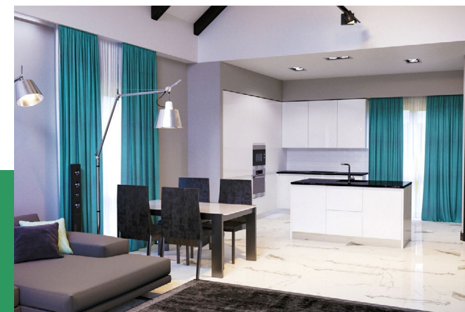
Тот самый любимый цвет.

ПРАВИЛО №7 ИСПОЛЬЗУЙТЕ ОДИН, ДВА ОСНОВНЫХ ЦВЕТА, И ДОБАВЬТЕ НЕ БОЛЬШОЙ АКЦЕНТ, ТОТ САМЫЙ ЛЮБИМЫЙ ЦВЕТ.