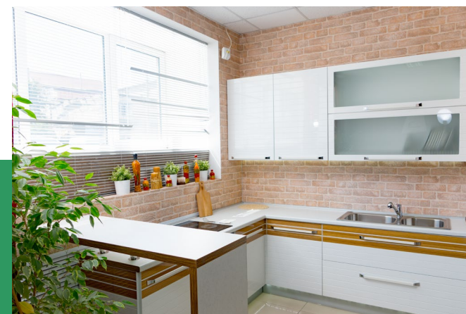
Нет розеток нет и техники.