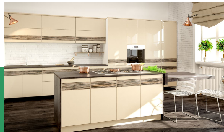
Материалы используемые в мебельном производстве в большинстве своем имеют одно качество, они одинаково экологичны, и по сути своей абсолютно одинаковы.