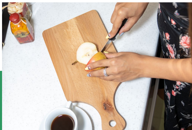
Защищаем самые стойкие материалы.

ПРАВИЛО №6 УДЕЛИТЕ ВНИМАНИЕ МАТЕРИАЛАМ КОТОРЫЕ ЛЕГКО ОТМЫВАЮТСЯ. ДАЖЕ САМЫЕ СТОЙКИЕ И ПРОЧНЫЕ МАТЕРИАЛЫ ПОДВЕРЖЕНЫ СТАРЕНИЮ.